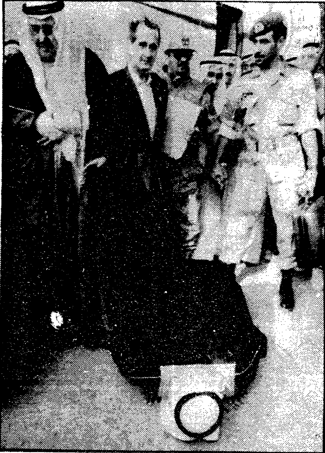
Crown Prince Saad al-Sabah of Kuwait kisses the ground after alighting from the plane at Kuwait City international airport on Monday as he returned from exile following the war.

ایسا اگر جان بوجھ کر کیا جائے تو وہ بہت ناسان ہے جو اللہ کے نزدیک بہت بڑا جرم ہے۔ تاہم اگر حقیقت حال آدمی کے علم میں نہ ہو تب بھی وہ یقینی طور پر قصور وار ہے۔ کیوں کہ شریعت میں اس قسم کی بات کی تحقیق کا لازمی حکم دیا گیا ہے۔ ایسے کسی معاملہ میں آدمی اگر اپنی زبان کھولنا چاہتا ہے تو اس پر لازم ہے کہ وہ پہلے اس کی ضروری تحقیق کرے۔ اور اگر وہ کسی وجہ سے تحقیق نہیں کر سکتا ہے تو اس کو چاہئے کہ وہ اس معاملہ میں چپ رہے، نہ کہ ناکافی معلومات کو لے کر اس پر بولنے لگے۔