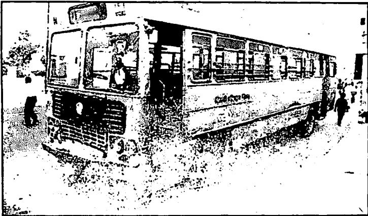
BJP workers deflated tyres of a DIC bus during the "Bandh"...

اس وقت ملک کا اصل مسئلہ گاڑی کو روکنا نہیں ہے۔ بلکہ رکی ہوئی گاڑی کو چلانا ہے۔ ملک کی آزادی پر نصف صدی کی مدت پوری ہو رہی ہے، مگر اب تک ہمارا ملک ترقی کی شاہراہ پر